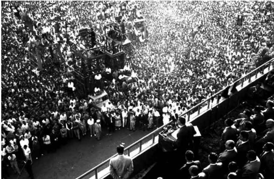
خطاب الرئيس فى ميدان الجمهورية عقب الانفصال ١٩٦١/٩/٢٩

أصدر الرئيس جمال عبد الناصر قراراً بقطع العلاقات الدبلوماسية مع .. المملكة الأردنية الهاشمية، ومع الجمهورية التركية؛ نظراً للموقف العدائى الذى اتخذته كل منهما تجاه ج.ع.م والوحدة العربية.